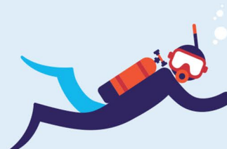
Travail en milieu hyperbare 60 interventions par an