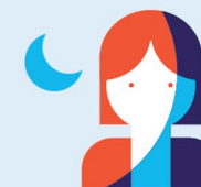
Travail de nuit 120 nuits par an

› A savoir : le dispositif entre en vigueur en 2015 pour ces 4 facteurs et en 2016 pour 6 autres.